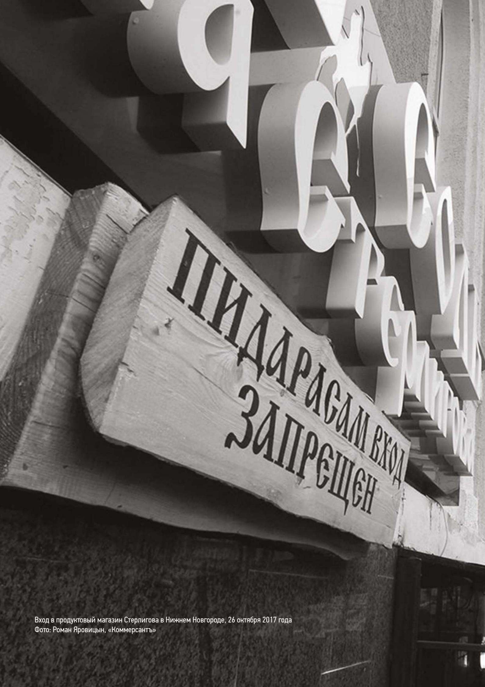
Вход в продуктовый магазин Стерлигова в Нижнем Новгороде, 26 октября 2017 года