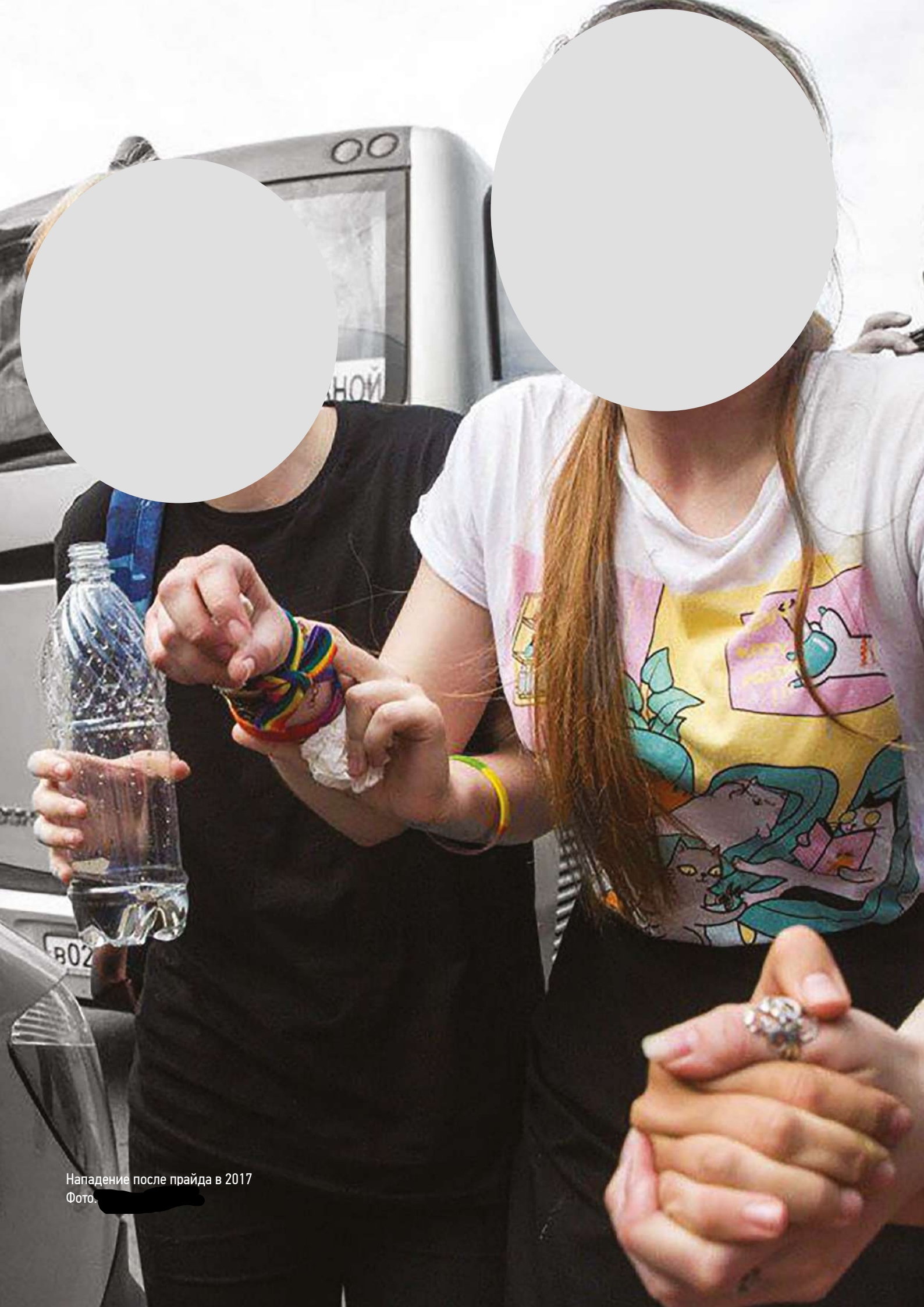
Нападение после прайда в 2017