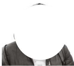
основатель портала «Парни+»

«Портал уже больше десяти лет подробно и въедливо рассказывает о возрастающей с каждым буквально месяцем эпидемии ВИЧ в России и говорит читателям о необходимости ВИЧ-профилактики. В том числе информирует и о скрытых в лукавой общей статистике Министерства здравоохранения России кошмарных темпах новых заражений ВИЧ среди мужчин, практикующих секс с мужчинами.