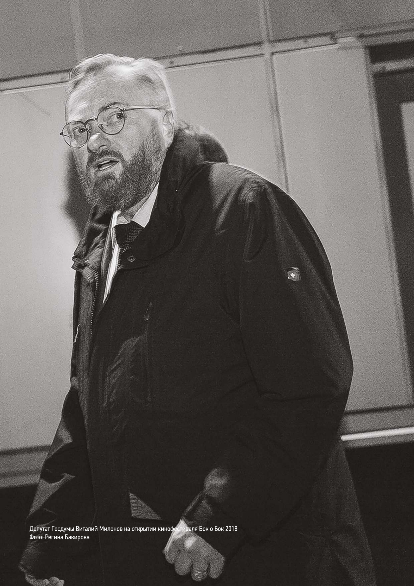
Депутат Госдумы Виталий Милонов на открытии кинофестиваля Бок о Бок 2018