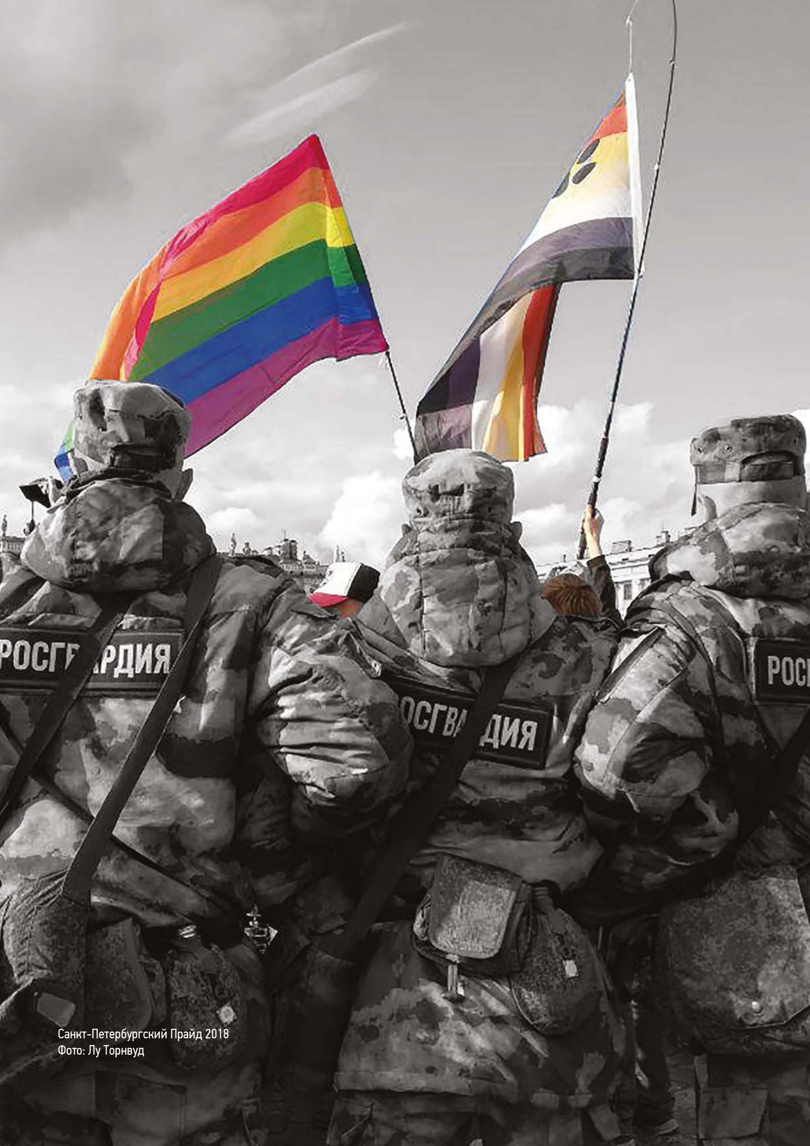
Санкт-Петербургский Прайд 2018